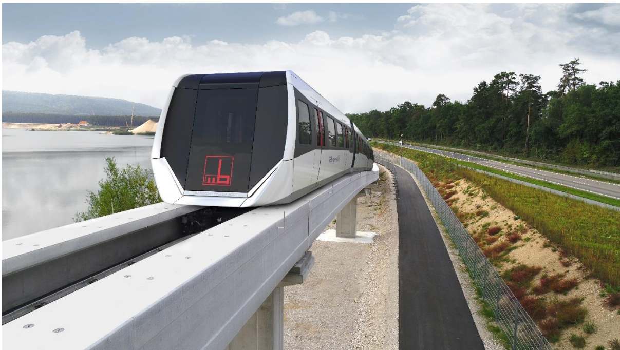
TSB auf der Teststrecke in Sengenthal, Deutschland.