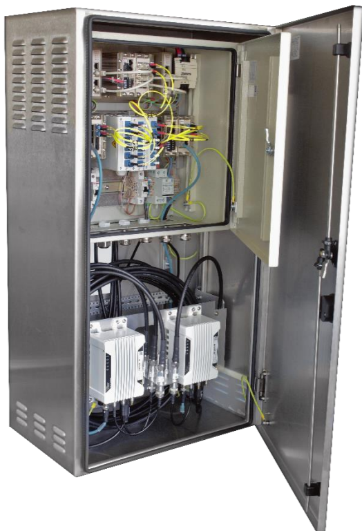
Westermos speziell entwickelte Trackside-Radio-Equipment-Box (TRE-Box)

Ein wichtiger Teil der Netzwerklösung ist eine speziell entwickelte, streckenseitige „Trackside-Radio-Equipment-Box“ (TRE-Box), die WLAN-Accesspoints, RedFox-Ethernet-Switche und Glasfaserabschlüsse enthält. Die TRE-Boxen von Westermo bilden die Zugangspunkte zum redundanten Ringnetzwerk. Die vorgefertigten TRE-Boxen sind vollständig ausgestattet, getestet und konfiguriert. Dies vereinfacht die Inbetriebnahme massiv und spart somit Zeit und Kosten bei der Installation sowie der Inbetriebsetzung.